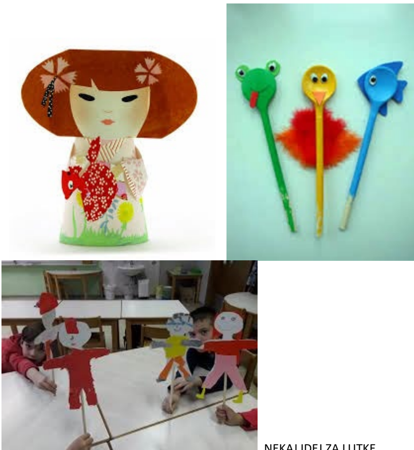
NEKAJ IDEJ ZA LUTKE....

Če pa imaš brate ali sestre, pri ustvarjanju sodelujte vsi.